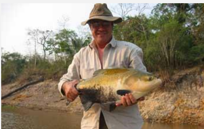
Тамбаки ( Colossoma macropomum ) Максимальный вес - 39 кг