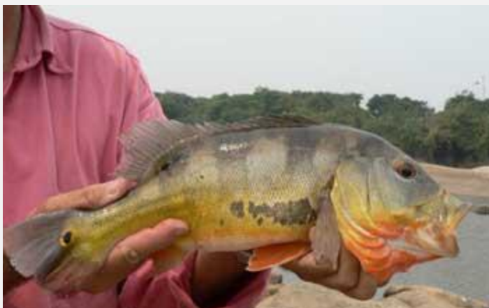
Тукунарэ (Peacockbass) Максимальный вес - 5 кг