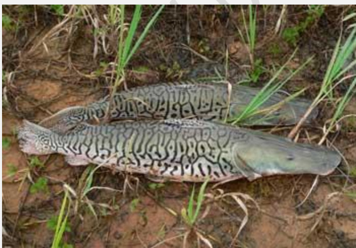
Суруби ( Pseudoplatystoma trigrinum ) Максимальный вес - 38 кг