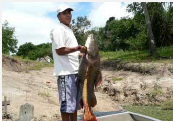
Коронель ( Phractocephalus hemiliopterus ) Максимальный вес - 28 кг