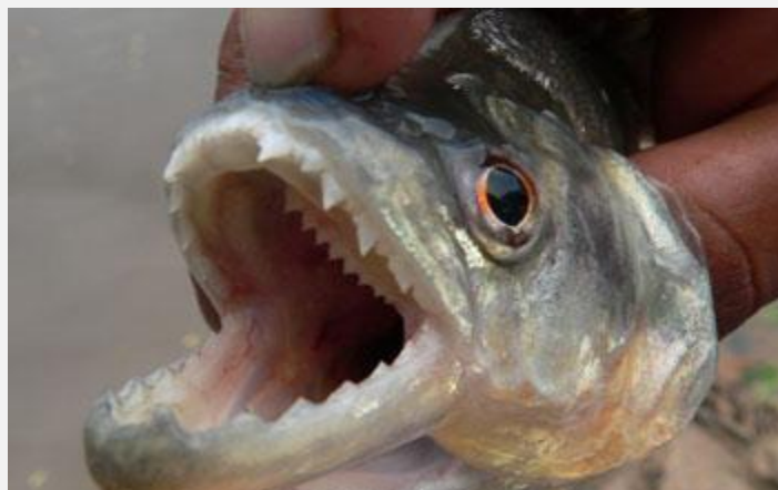
Пирания (Pygocentrus nattereri) Максимальный вес - 2.8 кг