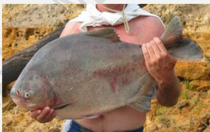
Пирапитига ( Piaractus brachipomus ) Максимальный вес - 13 кг